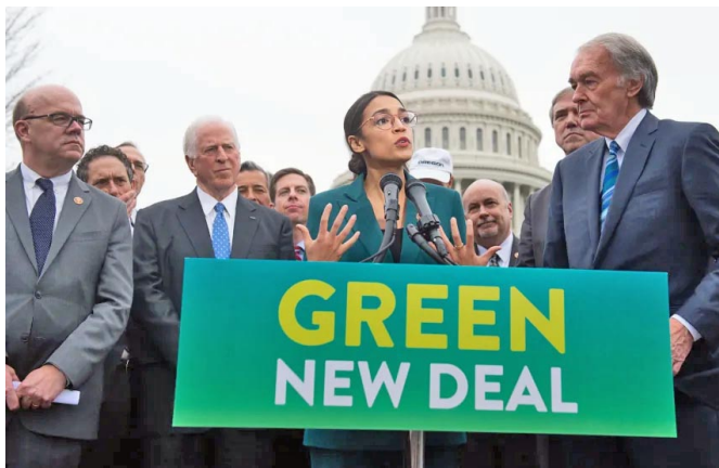
Alexandria Ocasio-Cortez.

geloofwaardige kennis schreef me het volgende over zijn recente gesprek met een insider uit Ottawa (Ottawa is de federale hoofdstad van Canada en de regerings- en parlamentszetel). De insider , zei hij, had gewerkt aan een adviesgroep voor de Trudeau-regering. De groep is niet opgericht om beleid te bespreken voor een termijn van vijf jaar, waarin regeringen meestal geïnteresseerd zijn, maar om beleid te ontwikkelen voor de verdere toekomst, over 20 tot 40 jaar. Dat hield in dat de groep had geconcludeerd, dat het huidige economische model gebrekkig is en moet worden vervangen. "Niet-gereguleerd consumptisme was niet duurzaam en mensen zouden moeten leren om het met minder te doen. De overheid zou meer controle over mensen moeten hebben om hen soberheid af te dwingen en de rijkdom van ontwikkelde landen zou opnieuw moeten worden verdeeld om ontwikkelingslanden te helpen."